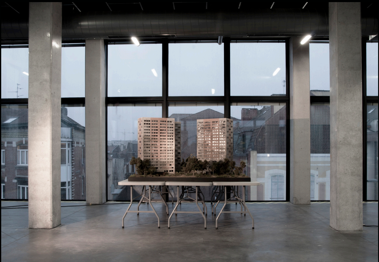
Cité, ensemble d'immeubles Le Flow, centre des cultures urbaines, Lille, 2016 240 x 280 cm, modeles reduits, elements vegetaux, mise en lumiere et bande son