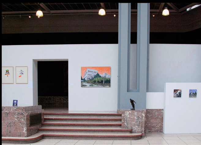
PRIX ARTISTIQUE DE LA VILLE DE TOURNAI Palais des Beaux arts, 2018