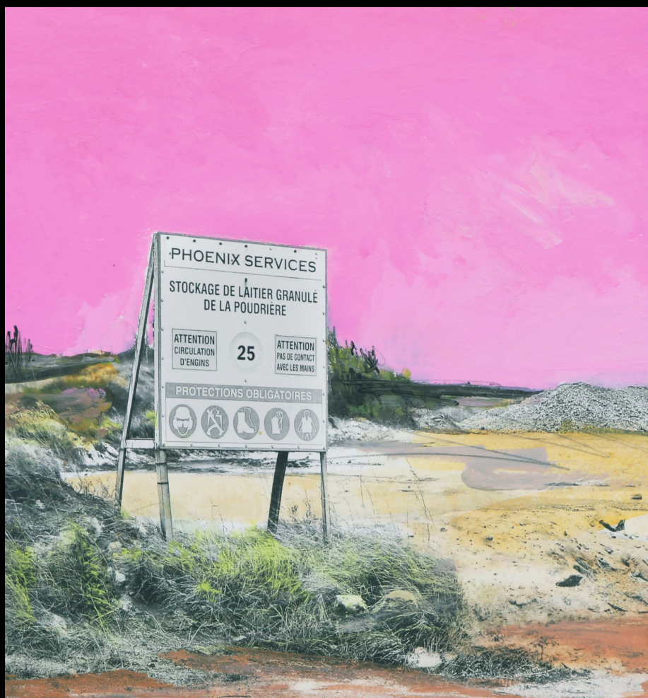
SABLIERE_DUNKERQUE_2020 techniques mixtes, photographies-peinture œuvre sur bois, 30x30 cm

Ainsi, je nommerai ci-dessous ce processus sous le terme de techniques mixtes.