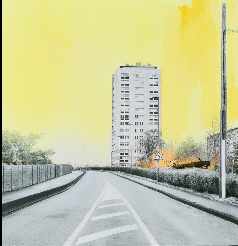
IMMEUBLE_ LILLE_2022 techniques mixtes, photographies-peinture oeuvre sur bois, 30x30 cm