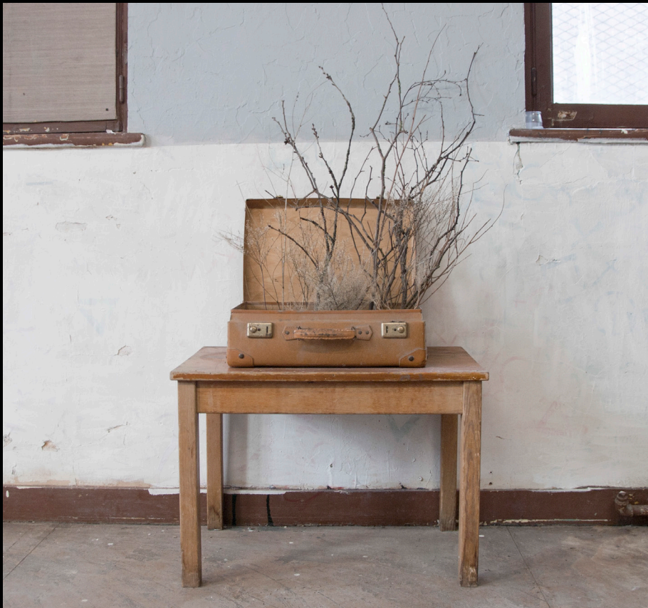
Valise et racines Gare Saint Sauveur, Lille ,2019 Assemblage de valise, béton et éléments végétaux

C'est donc une forme d'interaction que je trouve particulièrement intéressante.