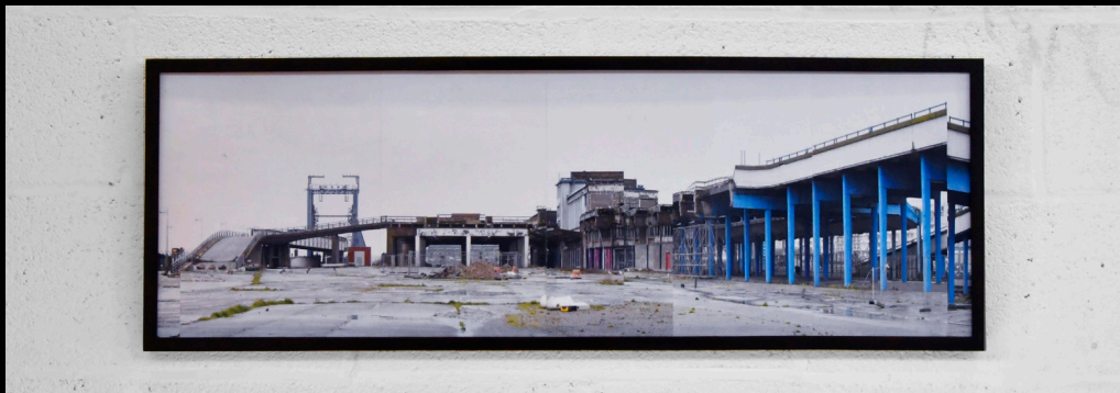
Terminal de Ferry, Boulogne-sur-mer, France, 2021 90x30 cm, impression vynil sur Dibond

Une partie de ces travaux [ traitant du patrimoine portuaire et industriel de la Cote d'Opale ] entrent dans le cadre d'un dispositif de bourse dont j'ai bénéficié en 2019-2020, subventionnée par la région Hauts-de-France