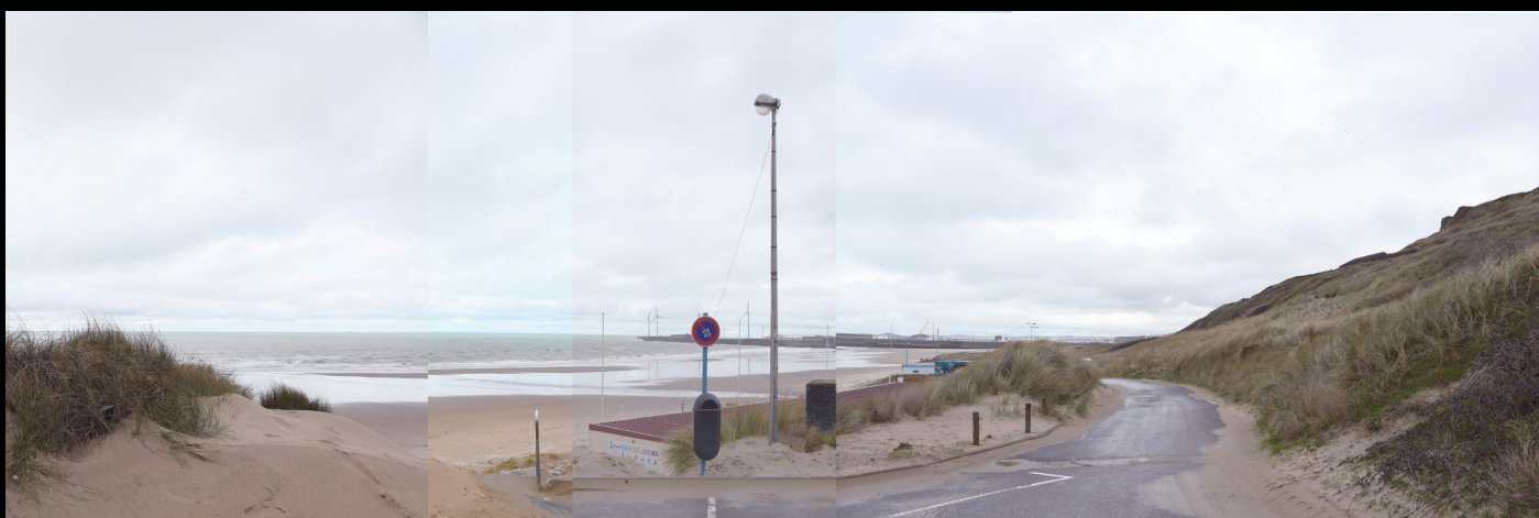
Plage de tourisme, Le Portel, 2020, epreuve numerique [90x30cm]