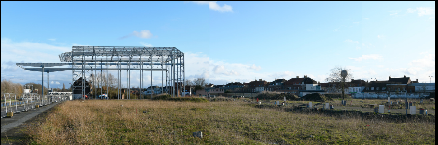
Strucutre en construction, Arques, 2020, epreuve numerique [90x30cm]