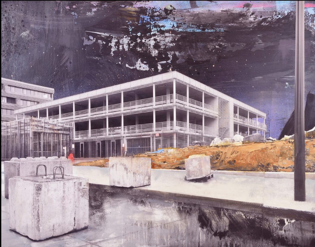
PARKING_ROUBAIX_2021 techniques mixtes, photographie-peinture oeuvre sur bois, 80x60 cm