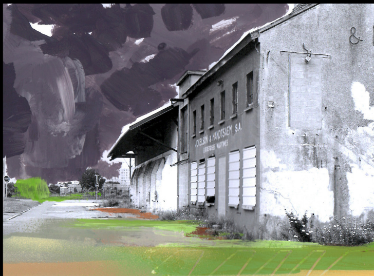
OEUVRES SUR PAPIER_2021 techniques mixtes sur prints, environ 21x30 cm