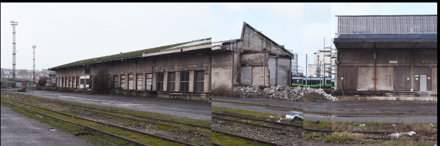
Gare de fret, Boulogne-sur-mer, 2020, epreuve numerique [90x30cm]