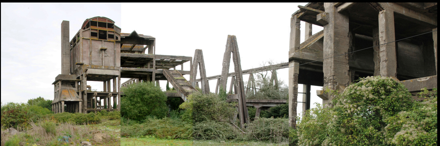
Fonderie, Saint Nazaire, 2015, epreuve numerique [90x30cm]