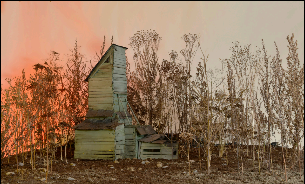
Grenier Showcase studio, Lille, 2021 220 x 180 cm, modele reduit, elements vegetaux, mise en lumiere et bande son