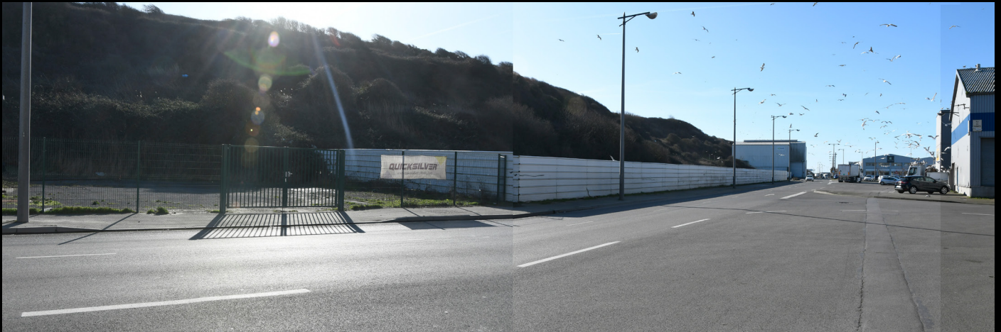
Zone portuaire [mouettes], Boulognes -sur-mer, 2020, epreuve numerique [90x30cm]