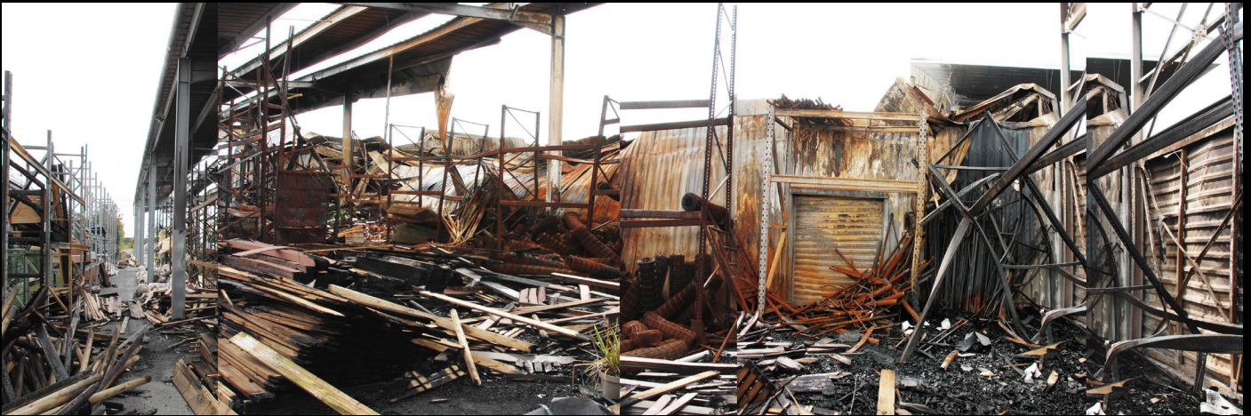
Magasin de bricolage incendié, Bain de Bretagne, 2014, epreuve numerique [90x30cm]