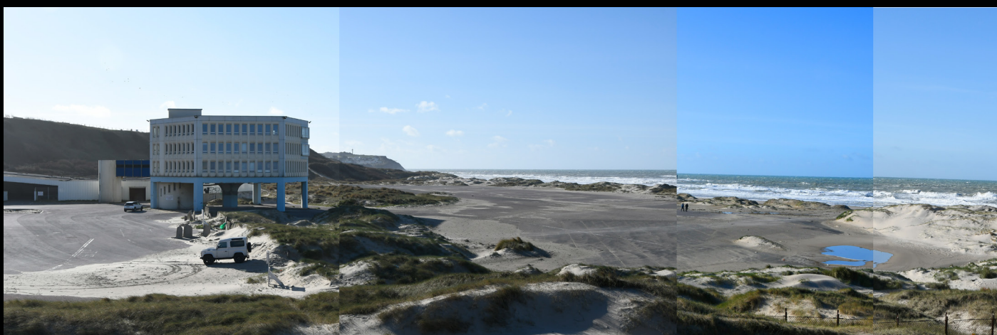
Hoverport, Boulogne-sur-mer, 2020, epreuve numerique [90x30cm]