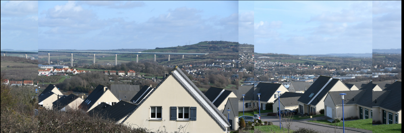
Zone pavillonnaire, Boulogne -sur-mer, 2020, epreuve numerique [90x30cm]