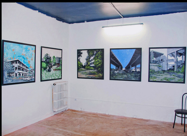
EXPOSITION "VILLES SAUVAGES" Galerie Hors Cadre, Beauvais, 2017