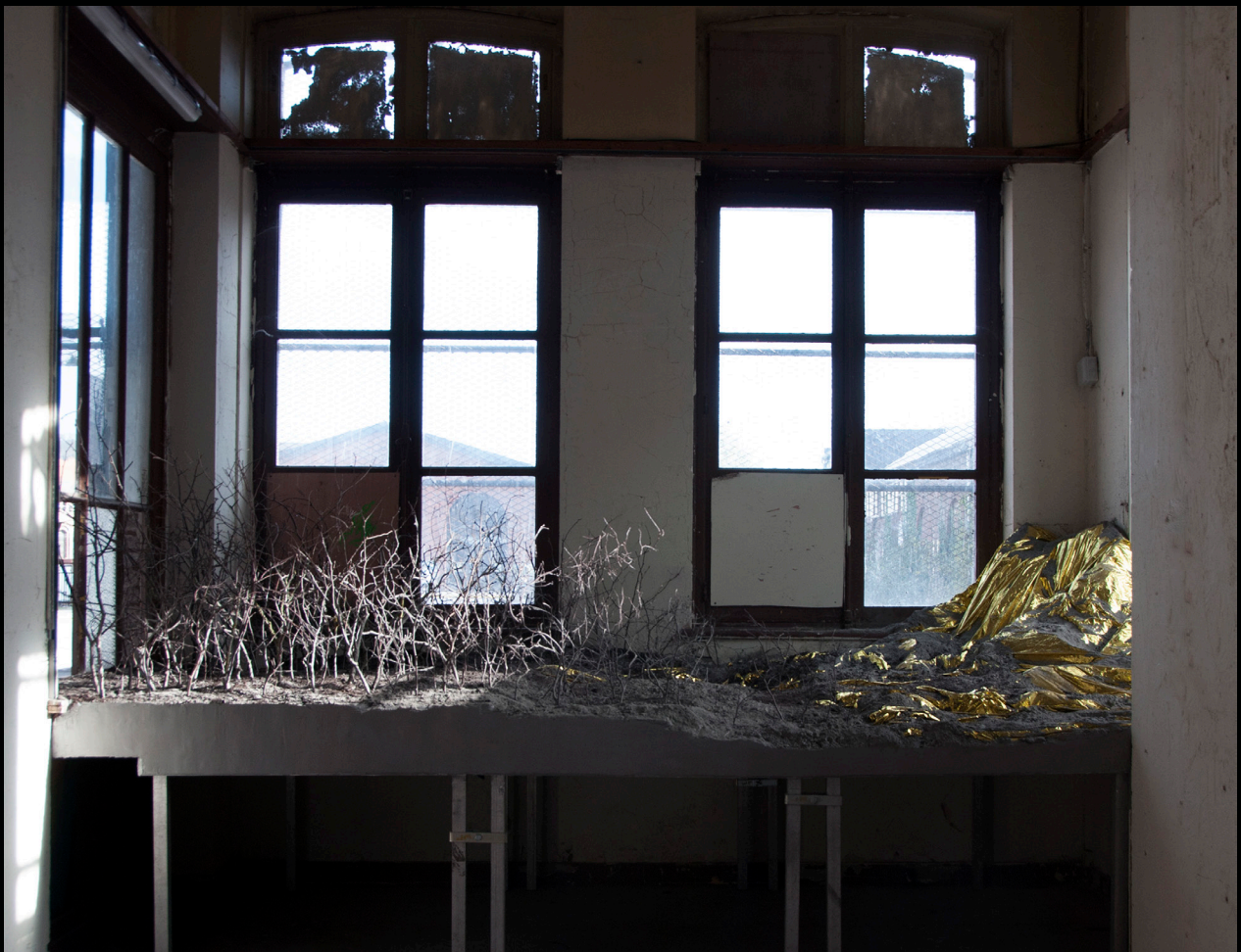
El dorado, Gare Saint sauveur, residence Malterie x Lille 3000, 2019 360 x 200 cm, elements vegetaux, ciment, couverture de survie.