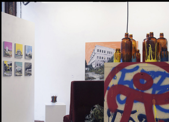
EXPOSITION "BIENS URBAINS" QSP GALERIE, Bureau D'art et recherche, Roubaix, 2020