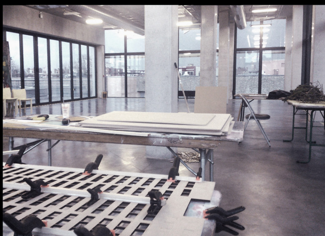
RESIDENCE DE CREATION AU FLOW Centre des cultures urbaines, Lille, 2016