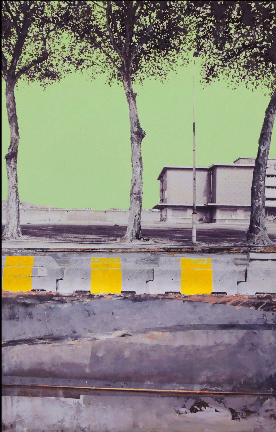
QUAIS_ROUEN_2020 techniques mixtes, photographies-peinture oeuvre sur bois, 130x 80 cm