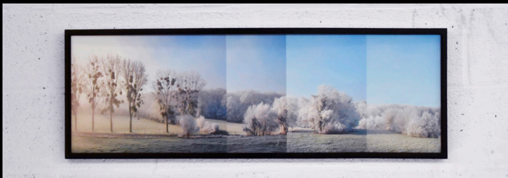
Foret domaniale, Oise, France, 2021 90x30 cm, impression vynil sur Dibond