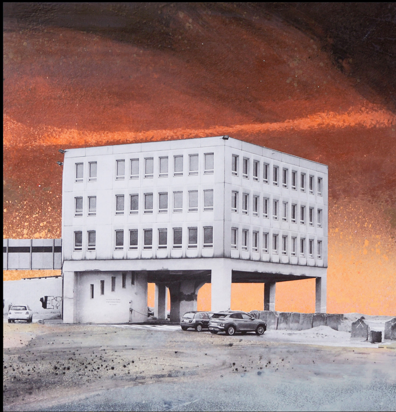
HOVERPORT_ BOULOGNE-SUR-MER_2022 techniques mixtes, photographies-peinture oeuvre sur bois, 30x30 cm