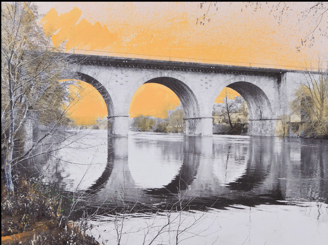
VIADUC_LIMOGES_2022 techniques mixtes, photographie-peinture oeuvre sur bois, 30x40 cm