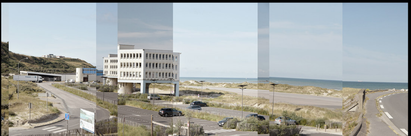
Hoverport, Boulogne-sur-mer, 2020, epreuve numerique [90x30cm]