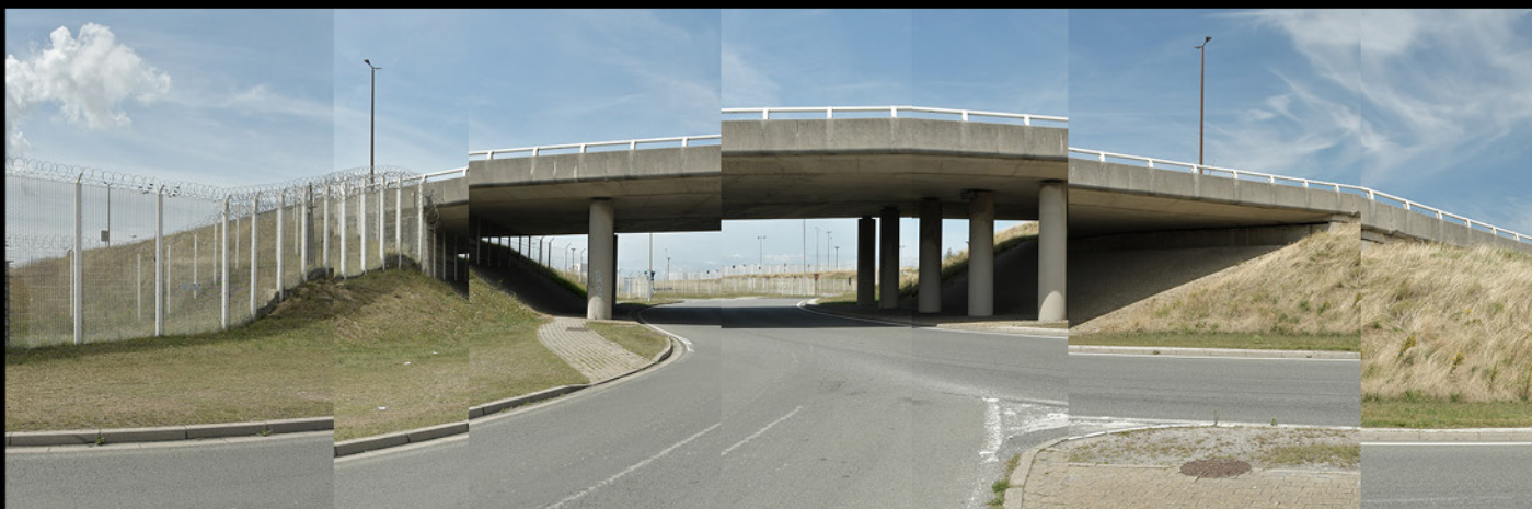
Pont, Calais, 2023, epreuve numerique [90x30cm]