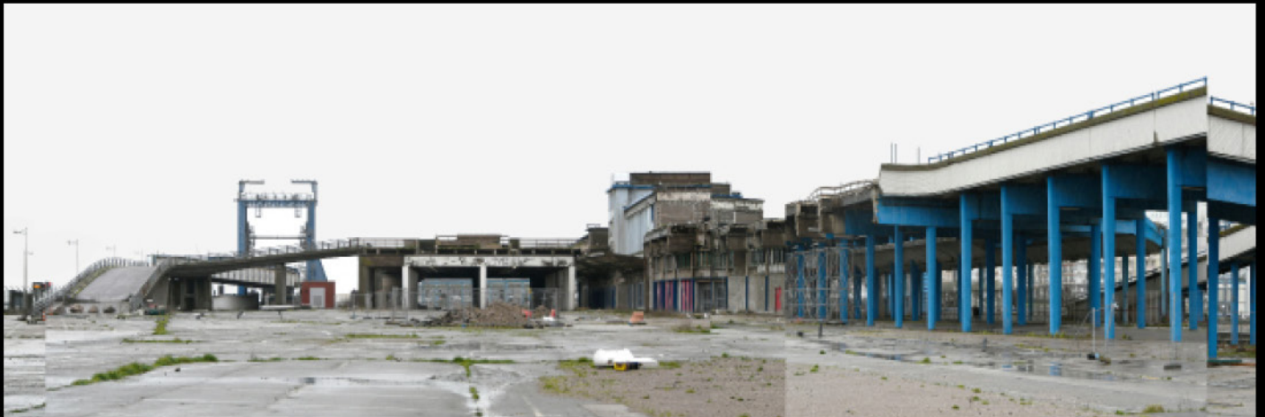
Terminal de ferry, Boulogne -sur-mer, 2020, epreuve numerique [90x30cm]