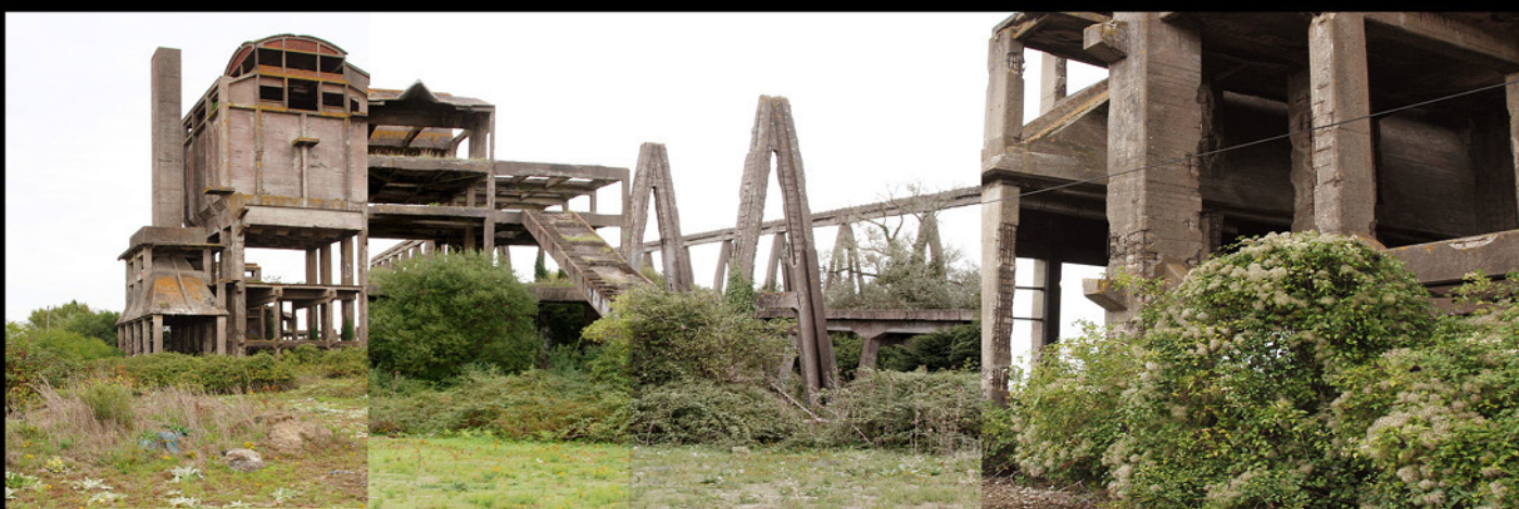
Fonderie, Saint Nazaire, 2015, epreuve numerique [90x30cm]