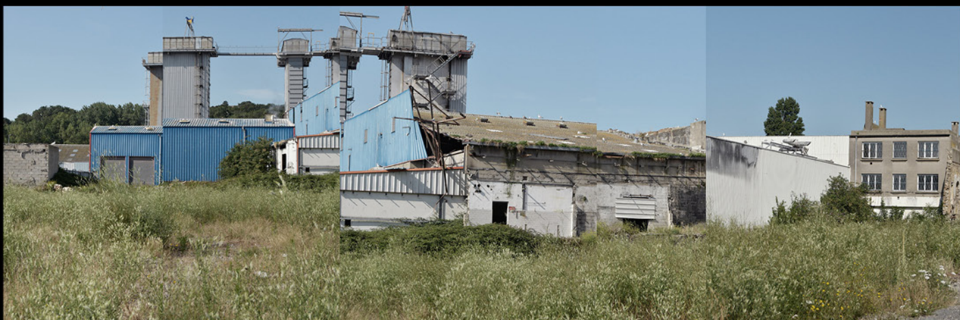
Usine en friche, Boulogne-sur-mer, 2023, epreuve numerique [90x30cm]