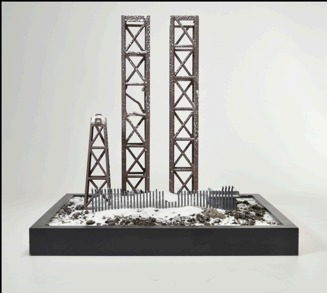
Structure enneigée, 2022