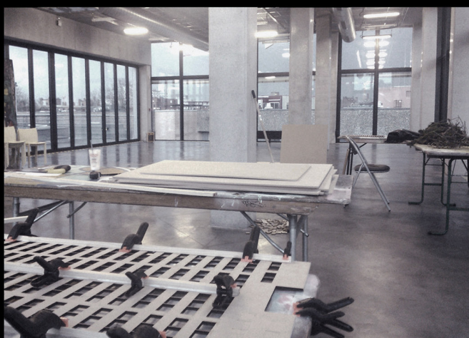
RESIDENCE DE CREATION AU FLOW Centre des cultures urbaines, Lille, 2016