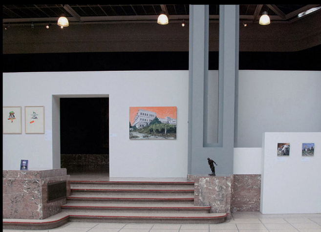
PRIX ARTISTIQUE DE LA VILLE DE TOURNAI Palais des Beaux arts, 2018