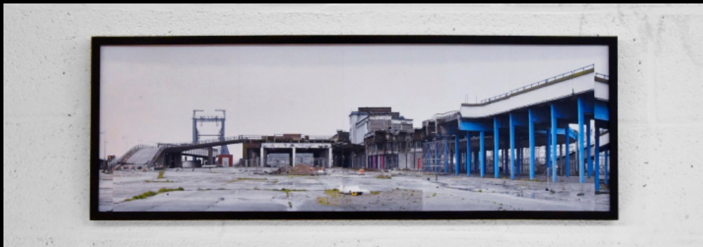
Terminal de Ferry, Boulogne-sur-mer, France, 2021 90x30 cm, impression vynil sur Dibond

Une partie de ces travaux [ traitant du patrimoine portuaire et industriel de la Cote d'Opale ] entrent dans le cadre d'un dispositif de bourse dont j'ai beneficié en 2019-2020, subventionnée par la région Hauts-de-France