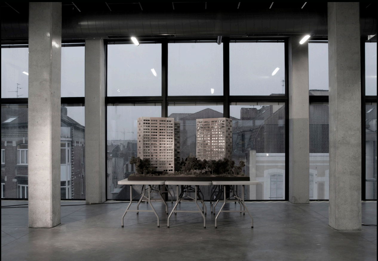
Cité, ensemble d'immeubles, 2016

120 x 240 x 60 cm, mise en lumière et bande son