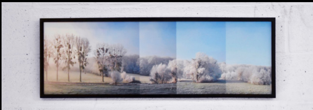
Foret domaniale, Oise, France, 2021 90x30 cm, impression vynil sur Dibond