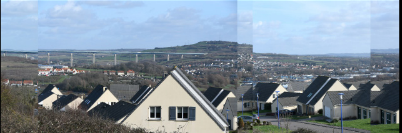
Zone pavillonnaire, Boulogne -sur-mer, 2020, epreuve numerique [90x30cm]