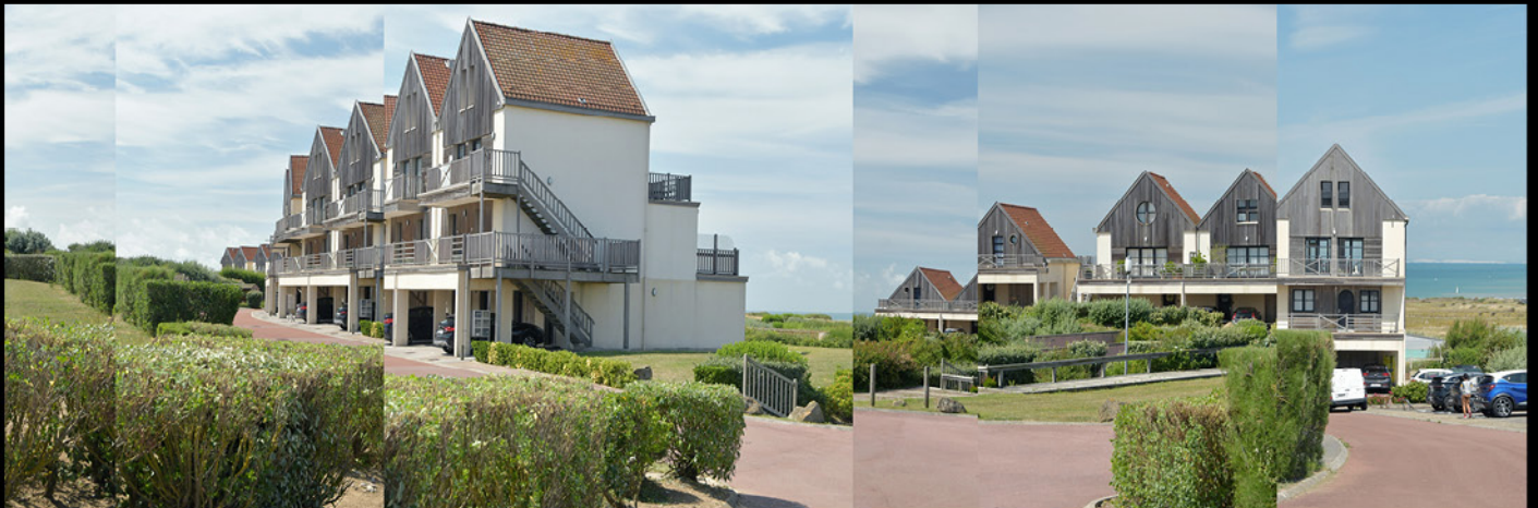
Village vacance, Boulogne-sur-mer, 2023, epreuve numerique [90x30cm]